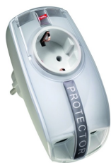
Zobrazení je nezávazné